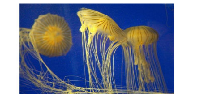
Le continent sous-marin est toujours très inconnu et David Wahl en donne à voir la réalité.

"La vie profonde" de David Wahl : voyage en compagnie des explorateurs d'abysses océaniques